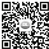
电力标准信息微信