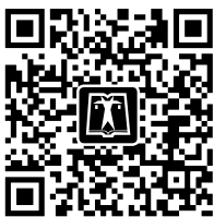
中国电力出版社官方微信